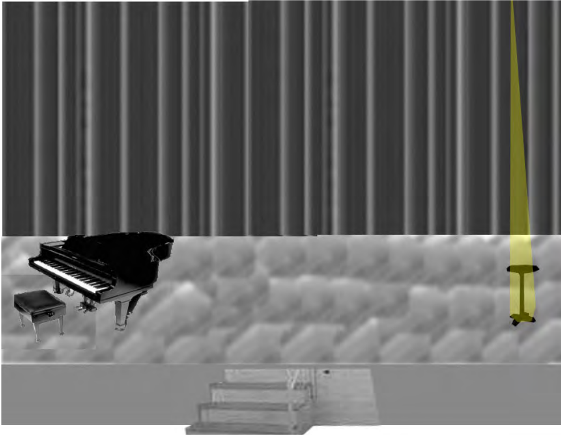
Abbildung 7 a („finger“ und Auftrittslight 2. teil)

zweiter Teil: der "Finger von oben" (Tischchen wird gestellt)